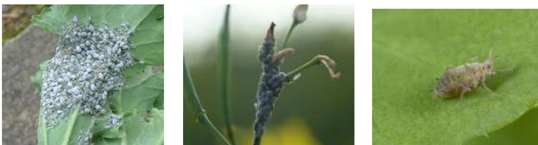
شکل ۱- کلنی شته مومی روی برگ و گل کلزا و حشره کامل شته مومی

تخم ها سیاه و شلغمی، کورنیکولها کوچک و وسط آنها قطور و حدود ۰/۱۶ میلی متر و به رنگ قهوه ای تیره می باشند. شته های ماده بی بال به رنگ سبز روشن تا تیره و بدن آنها از ماده مومی آردمانندی پوشیده شده است. ماده های بالدار کاملاً سبز رنگ و پوشیده از ماده مومی شکل می باشند. سر و سینه آنها خاکستری تیره بوده و لکه های تیره از سر تا روی شکم امتداد دارد (شکل ۱).