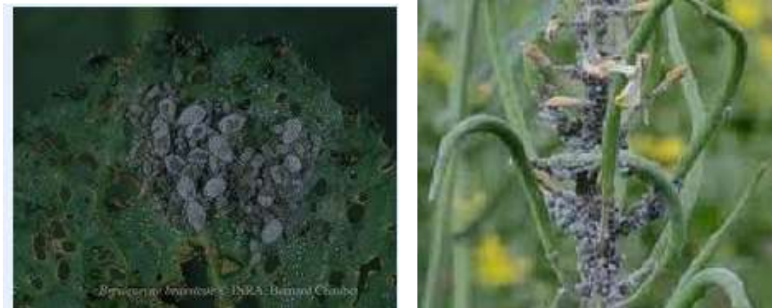
شکل ۲- خسارت شته مومی کلزا

زمان شروع و آلودگی و استقرار کلنی اولیه شته مومی روی کلزا و در مناطق مختلف ایران متفاوت است. این مرحله در بعضی از مناطق هم زمان با چند برگی بوته کلزا و در طول ماه های پائیز بوده و در بعضی از مناطق دیگر اواخر زمستان و یا اوایل بهار می باشد. شته مومی کلم معمولاً به صورت کلنی روی سطح برگ، ساقه، جوانه ها و هم چنین زیر برگ کلزا تجمع نموده و با خرطوم بسیار نازک خود از شیره برگ ها، ساقه های جوان، غنچه های گل و غلاف ها تغذیه می نماید، که آثار این تغذیه به صورت پیچیدگی برگ ها و جوانه های انتهایی، ضعف و پژمردگی، زردی برگها، توقف رشد، خشک شدن جوانه های انتهایی و در نهایت تشکیل غلاف های کوتاه نمایان می شود. حساس ترین مرحله رشدی کلزا به شته مومی در مرحله تشکیل غنچه گل، باز شدن گل ها و غلاف دهی می باشد. با تداوم تغذیه شته و ترشح عسلک باعث کثیف شدن اندام های گیاه گردیده و مشکلاتی را در برداشت بوجود می آورد. حمله بسیار شدید این شته ها می تواند کشت کلزا را در بعضی از مناطق کشور محدود نماید و چون اوج فعالیت شته در طول دوره گلدهی کلزا بوده که در این مرحله زنبور عسل و دیگر حشرات گرده افشان جهت جمع آوری گرده روی بوته ها فعالیت می نمایند، مبارزه شیمیایی با بسیاری از حشره کش ها منطقی نمی باشد. در ایران این آفت در مناطق گرم و خشک حالت طغیانی دارد زیرا شرایط برای رشد و نمو آفت مطلوب و مناسب بوده در صورتی که دشمنان طبیعی در این مرحله در مقابل جمعیت بیش از حد شته مومی قادر به کنترل طبیعی کلنی شته مومی موجود نبوده و در آلودگی های شدید در بعضی از مناطق حداقل نیاز به چندین نوبت مبارزه می باشد(.. شکل ۲).